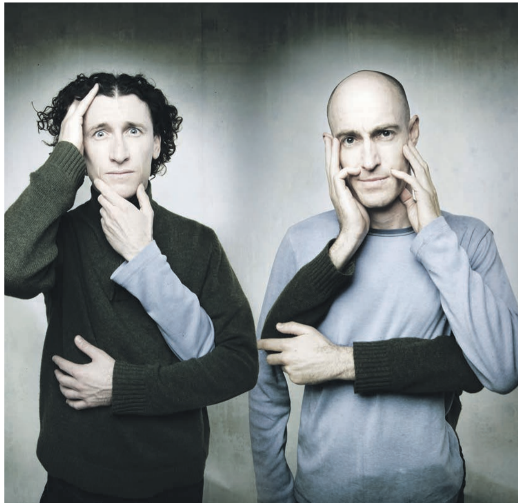
Die Paten. The Umbilical Brothers aus Australien übernehmen die Patenschaft an dieser siebten Artistika.